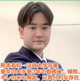
熊本高校→法政大学卒業 東京の大手塾3年の勤務後、帰熊。 キレのある解説。児童分的な存在。